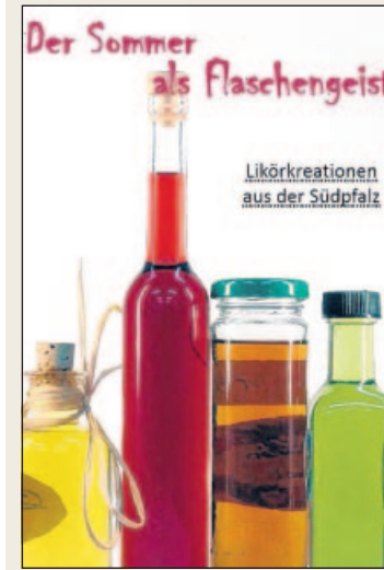
Jetzt erhältlich: das Büchlein mit den Rezepten des Likörwettbewerbss 2009.